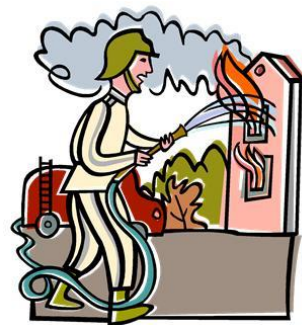
Hasičský záchranný sbor