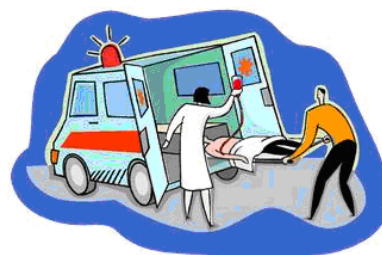
Zdravotnická záchranná služba