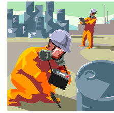
ÚNIK ŠKODLIVÉ LÁTKY